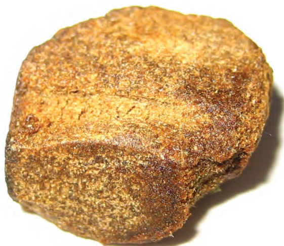
Concentrado de marihuana

Hay muchos métodos para convertir o “manufacturar” la marihuana en concentrados. Uno es el proceso de extracción con gas butano. Este proceso es particularmente peligroso porque utiliza gas butano para extraer el THC de la planta de cannabis, y dado que se trata de un gas altamente inflamable, el proceso ha resultado en violentas explosiones. Se han reportado laboratorios de extracción de THC en todo el país,