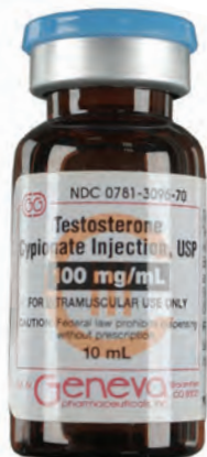
Inyección de cipionato de testosterona, USP