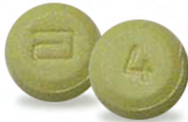
Píldoras de hidromorfona