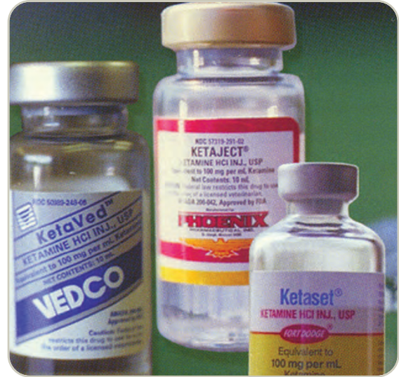
Frascos con ketamina líquida

La ketamina, junto con otras “drogas de club” se ha vuelto popular entre los adolescentes y adultos jóvenes en los centros nocturnos y raves. Es producida de manera comercial en forma de polvo o líquida. La