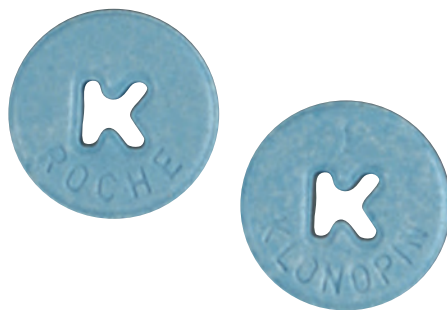
Comprimidos de Klonopin 5 mg

La mayoría de los depresores son sustancias controladas comprendidas en las Clasificaciones I, II, III o IV de la Ley de Sustancias Controladas, dependiendo del riesgo de abuso y de su uso médico aceptado actualmente. Muchos tienen usos médicos aprobados por la FDA. En los Estados Unidos, el Rohypnol® y el Quaaludes® no se fabrican ni se comercializan legalmente, y no tienen un uso médico aceptado en los Estados Unidos.