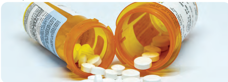
Comprimidos de oxicodona

Los productos que contienen oxicodona se encuentran en la Clasificación II de la Ley de Sustancias Controladas.