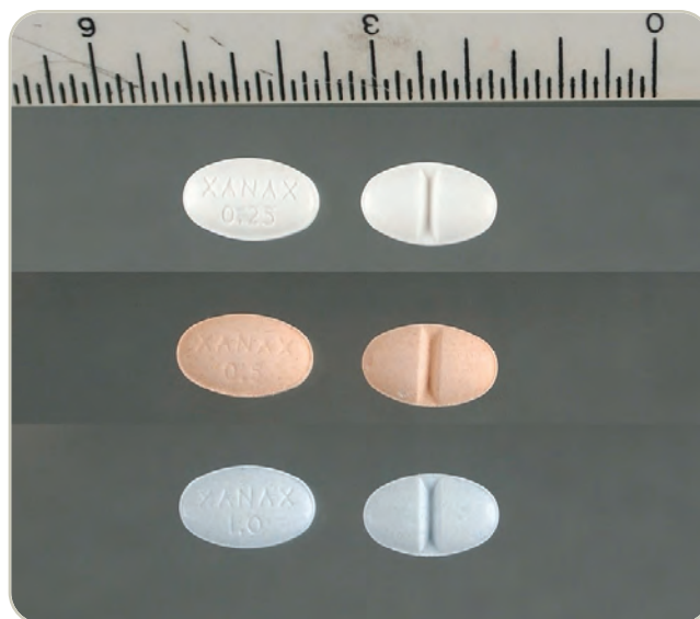
Comprimidos ranurados de Xanax 0.25, 0.5 y 1 mg

Generalmente, los productos farmacéuticos legítimos son desviados al mercado ilegal. Los adolescentes pueden obtener depresores del botiquín de casa, o a través de familiares, amigos, internet, doctores y hospitales.