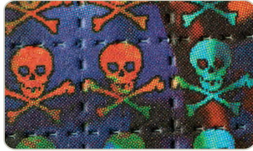
Papel secante para LSD

Durante la primera hora después de su ingestión, los consumidores pueden experimentar cambios visuales con cambios extremos en el estado de ánimo. Mientras duran las alucinaciones el consumidor puede sufrir alteraciones en la percepción de la profundidad y el tiempo, acompañadas por una percepción distorsionada de la forma y el tamaño de los objetos, los movimientos, colores, sonidos, el tacto y la imagen corporal de sí mismo.