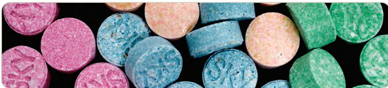
Comprimidos de MDMA/Éxtasis

energía, excitación sensual y sexual, necesidad de ser tocado y necesidad de estimulación.