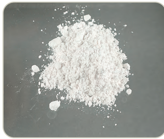
Heroína en polvo blanco