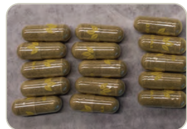
Cápsulas de kratom