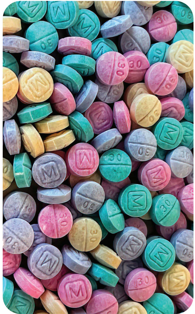
Pastillas falsas de oxicodona M30 que contienen fentanilo

El fentanilo es un narcótico de la Clasificación II bajo la Ley de Sustancias Controladas de los Estados Unidos de 1970.