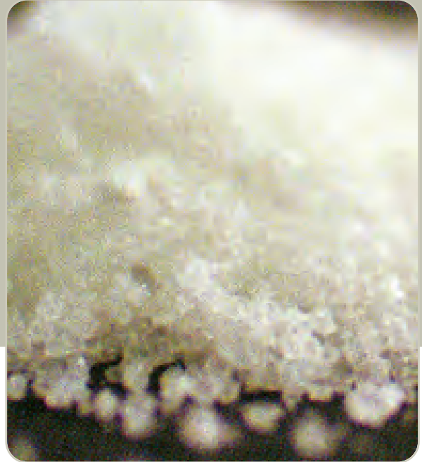
Sales de Baño

Las catinonas sintéticas se fabrican en Asia Oriental y han sido distribuidas a niveles mayoristas en Europa, Norte América, Australia y otras partes del mundo.