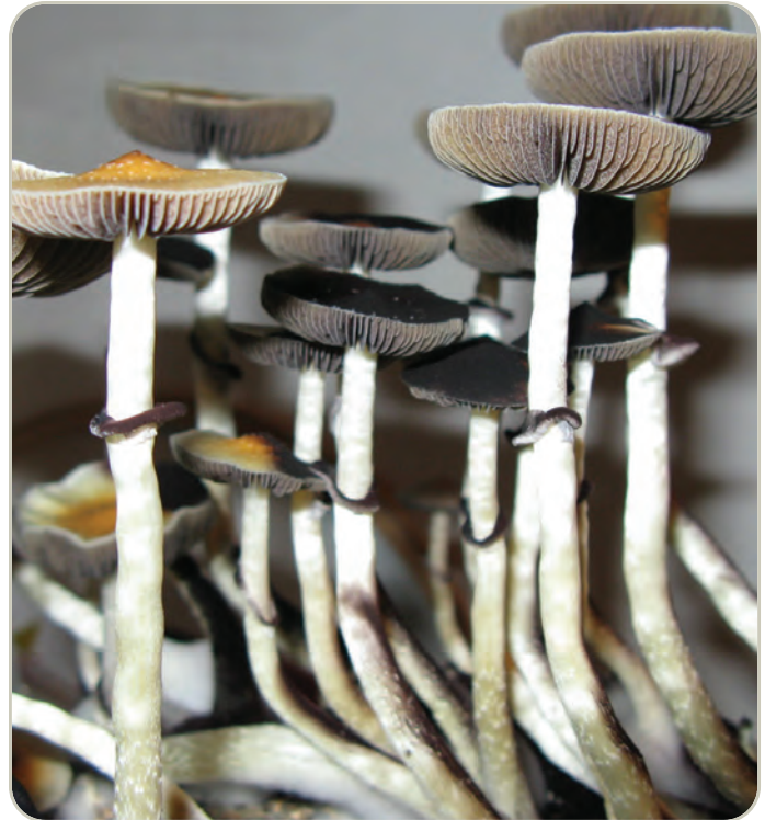
Setas de psilocibina