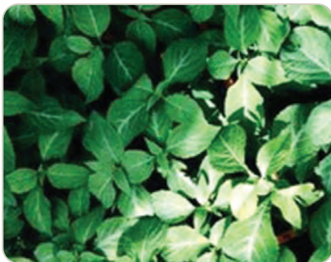
Hojas de la planta Salvia divinorum

La planta tiene hojas verdes en forma de espada similares a las de la menta. Las plantas pueden alcanzar más de un metro de altura, tener grandes hojas verdes, tallos huecos cuadrados y flores blancas con cálices púrpuras.