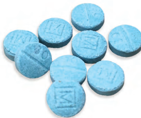
Tabletas de oxycodona falsificadas producidas clandestinamente que contienen fentanilo.

El abuso de opioides sintéticos de producción