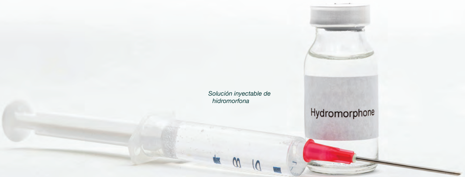
Solución inyectable de hidromorfona