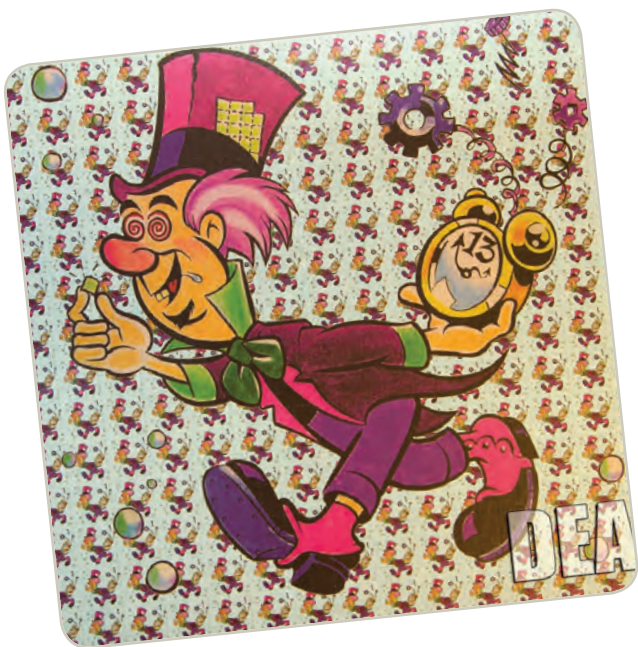
Papel secante con LSD