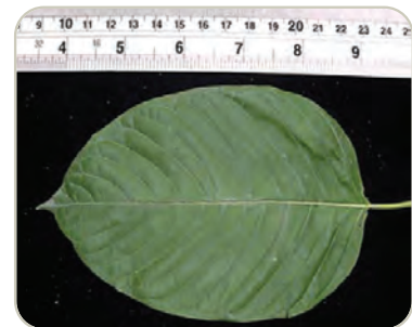
Hoja de árbol de kratom