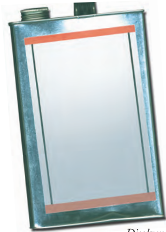
Disolvente de pintura

Los productos domésticos comunes como pegamento, líquido para encendedores, líquidos de limpieza y pintura producen vapores químicos que pueden inhalarse.