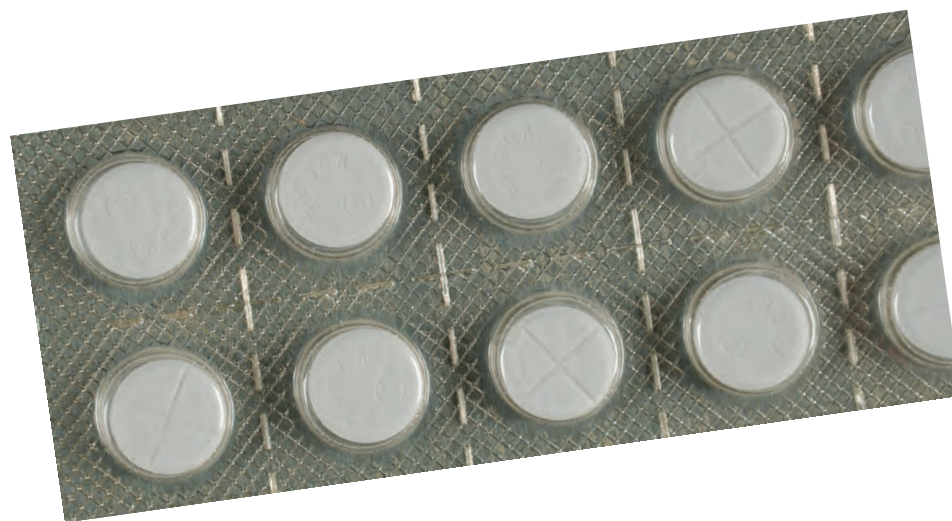
Blíster de comprimidos de Rohypnol®

El Rohypnol® es una sustancia de Clasificación IV bajo la Ley de Sustancias Controladas. La fabricación, venta, uso o importación a los Estados Unidos de Rohypnol® no está aprobada. Sin embargo, en otros países se fabrica y se comercializa legalmente. Las sanciones por posesión, tráfico y distribución que involucran un gramo o más son las mismas que las de las drogas de Clasificación I.