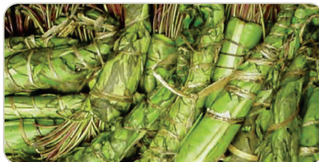
Planta de Khat

Generalmente se mastica como tabaco, se retiene en la mejilla y se mastica en forma intermitente para liberar la droga activa, que produce un efecto