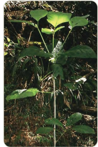
Árbol de kratom

El kratom no está regulado por la Ley de Sustancias Controladas; sin embargo, puede haber algunas regulaciones o prohibiciones estatales en contra de la posesión y el uso de kratom. La FDA no ha aprobado el kratom para uso médico. Además, la DEA puso al kratom como una droga y químico preocupante.