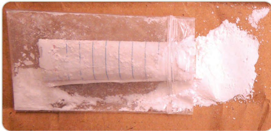
Opiode sintético en polvo U-47700.

clandestina se asemeja al de la heroína y a la prescripción de opioides analgésicos. Muchos de estos opioides sintéticos de producción ilegal son más potentes que la morfina y la heroína por lo tanto, tienen el potencial de ocasionar una sobredosis fatal.