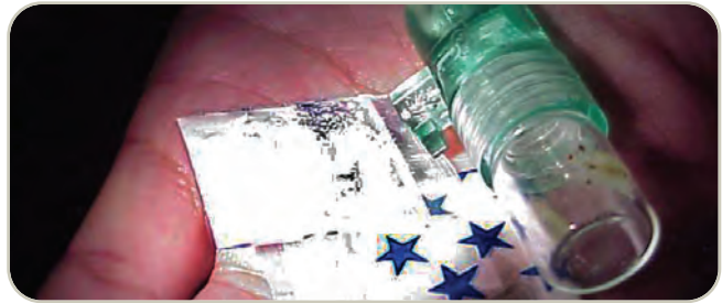
Ketamina en diversas formas

pupilas, salivación, secreciones lacrimales y rigidez muscular