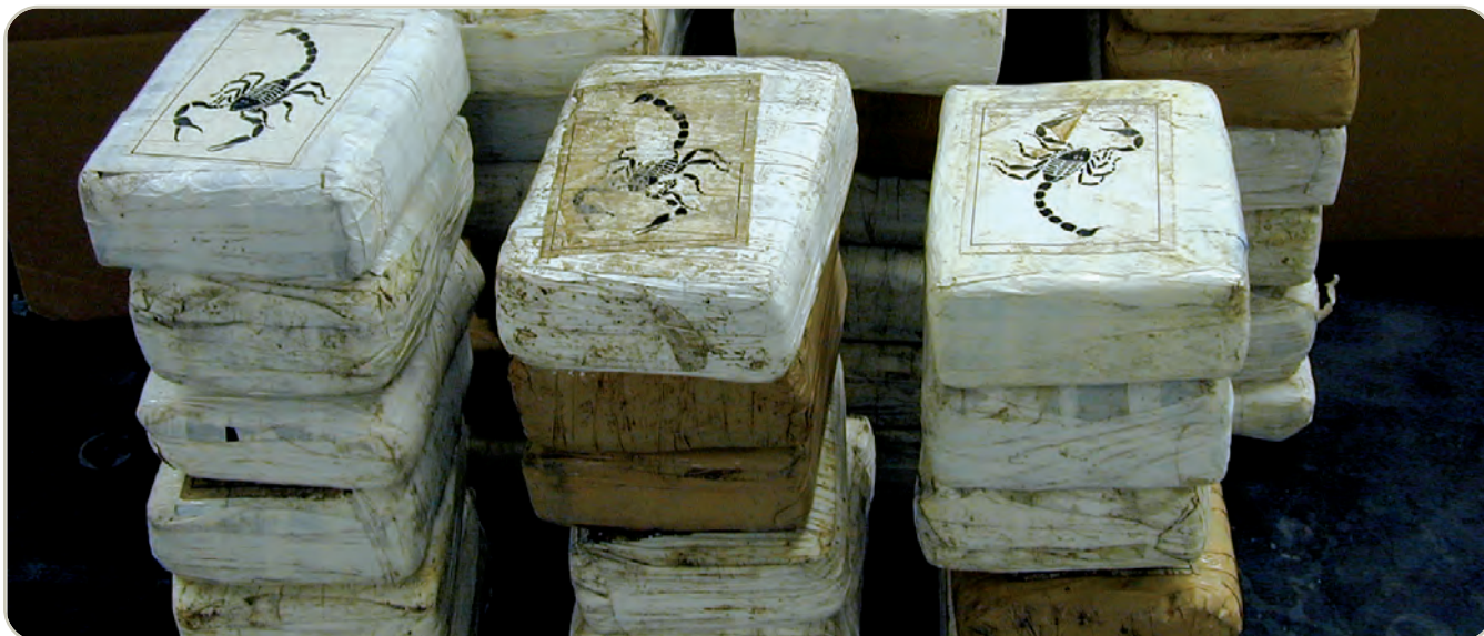
Ladrillos de cocaína, incautados por la DEA

La cocaína es una droga de Clasificación II bajo la Ley de Sustancias Controladas, lo que significa que tiene un alto potencial de abuso y un uso médico aceptado en la actualidad en los Estados Unidos. La solución de clorhidrato de cocaína (4 por ciento y 10 por ciento) se usa principalmente como anestésico local del tracto respiratorio superior. También se usa para reducir el sangrado de las membranas mucosas de la boca, garganta y cavidades nasales. Sin embargo, actualmente se han desarrollado productos más efectivos para estos propósitos, por lo que el uso médico de la cocaína en los Estados Unidos es raro.