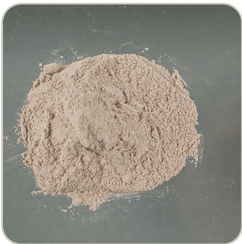
Heroína en polvo café