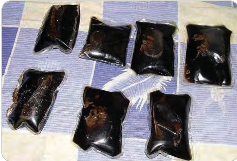
Paquetes de heroína líquida