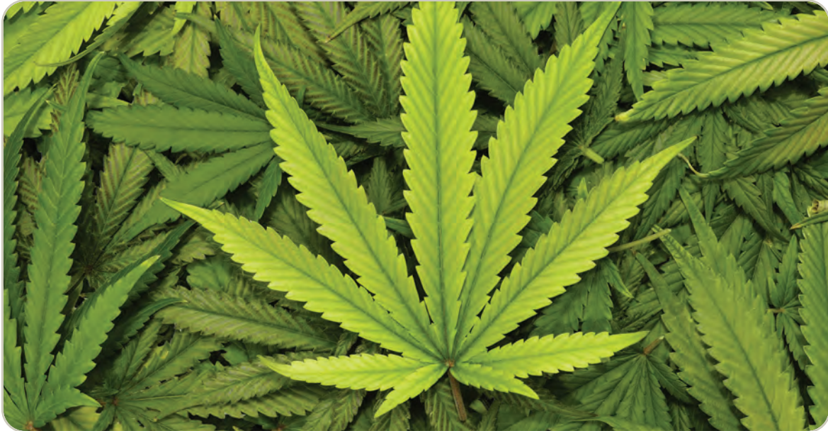
Hojas de marihuana