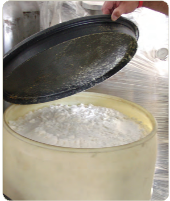
Metanfetamina en forma elaborada

La metanfetamina regular es una píldora o polvo. La metanfetamina cristal es similar a fragmentos de vidrio o “rocas” blanco azuladas brillantes de diversos