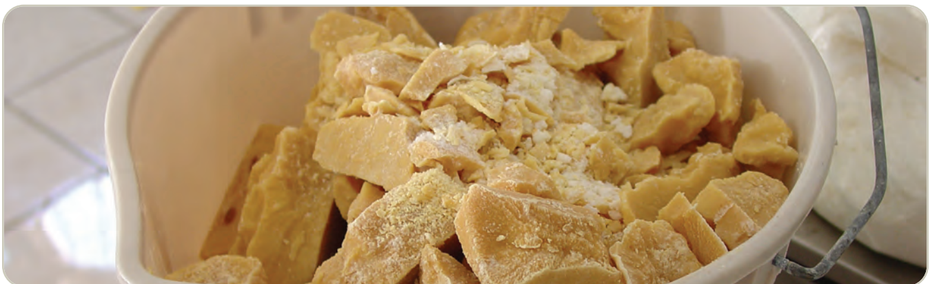
Metanfetamina en forma elaborada

Actualmente, hay solo un producto legal que contiene metanfetamina, el Desoxyn®. Se comercializa en tabletas de 5, 10 y 15 miligramos ( formulaciones de liberación inmediata y liberación prolongada) y tiene un uso muy limitado en el tratamiento de la obesidad y el TDAH.