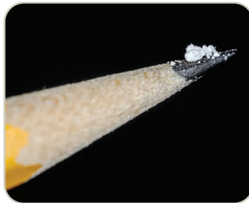
Una dosis letal de fentanilo

Desde 2011 hasta 2018, tanto las sobredosis fatales asociadas con el abuso de fentanilo y los análogos del fentanilo producidos clandestinamente, como los hallazgos policiales aumentaron notablemente. Según los Centros para el Control y la Prevención de Enfermedades (CDC), tanto en 2011 como en 2012, los análogos del fentanilo estuvieron involucrados en aproximadamente 2.600 muertes por sobredosis de drogas, pero desde 2012 hasta 2018, el número de muertes por sobredosis de drogas con fentanilo y otros opioides sintéticos aumentó dramáticamente cada año. Más recientemente, se ha producido un resurgimiento del tráfico, la distribución y el abuso de fentanilo y análogos de fentanilo producidos ilícitamente con un aumento dramático asociado de muertes por sobredosis que oscilan entre 2.666 en 2011 y 31.335 en 2018.