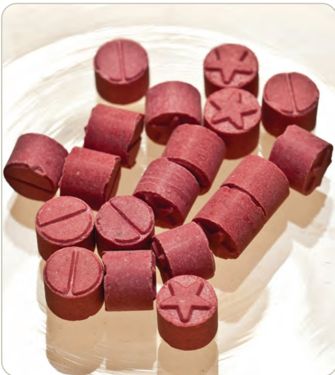
MDMA/Pastillas de éxtasis

Muchos alucinógenos son sustancias de Clasificación I bajo la Ley de Sustancias Controladas, lo que significa que tienen un alto potencial para el abuso, no tienen ningún uso médico aceptado en la actualidad en los Estados Unidos y carecen de la seguridad aceptada para su uso bajo supervisión médica.