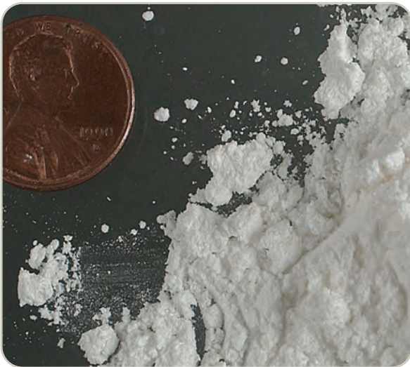
Polvo de cocaína

El clorhidrato de cocaína (HCl) generalmente se distribuye como un polvo blanco y cristalino. A menudo se diluye (“se corta”) con diversas sustancias, la más destacada es el