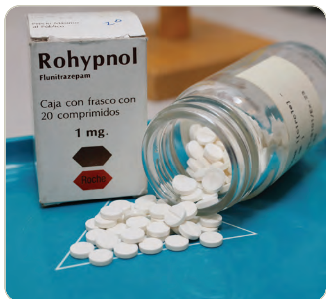
Comprimidos de Rohypnol®

El Rohypnol también se usa indebidamente para incapacitar física y psicológicamente a las víctimas