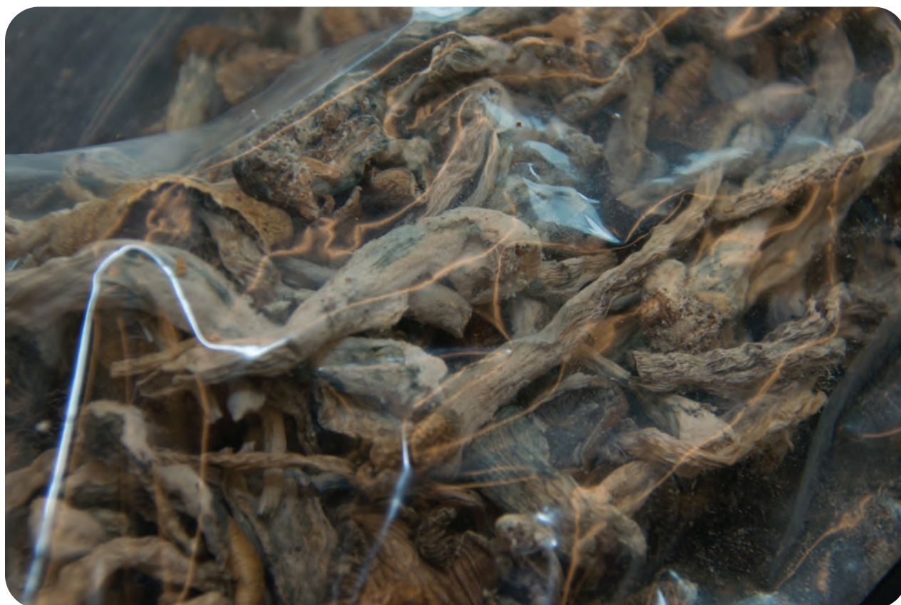
Setas de psilocibina

La psilocibina es una sustancia de Clasificación I de acuerdo a la Ley de Sustancias Controladas, lo que significa que tiene un alto potencial de abuso, no cuenta con autorización para uso médico para tratamiento en Estados Unidos y carece de seguridad para uso bajo supervisión médica.